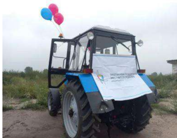
Александровский с/с Рыбинский район

Александровский сельсовет проект «Приобретение трактора» 1 640,0 тыс.рублей, в том числе: Краевой бюджет 1 394,0 тыс. рублей Местный бюджет – 82,0 тыс. рублей, Средства юридических лиц и предпринимателей – 114,8 тыс. рублей, Средства граждан – 49,2 тыс. рублей.