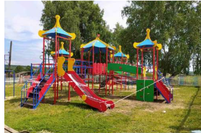
Новокамалинский с/с Рыбинский район

Двуреченский сельсовет проект «Устройство многофункциональной спортивно-игровой площадки в парке» 884,8 тыс.рублей, в том числе: Краевой бюджет 1 394,0 тыс. рублей Местный бюджет – 82,0 тыс. рублей, Средства юридических лиц и предпринимателей – 114,8 тыс. рублей, Средства граждан – 49,2 тыс. рублей.